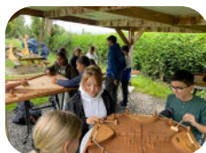
Jeux en bois