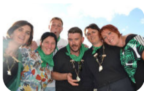
Les aventuriers du Mont-Dol