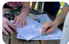
Le trésor de Borgnefesse