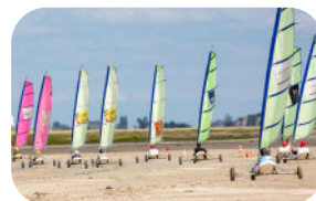
Plan baie Hirel