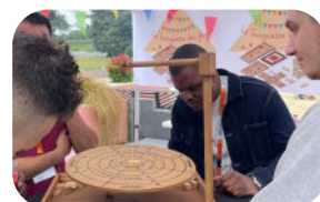
Guinguette des jeux en bois