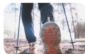
Initiation marche nordique

RETROUVEZ TOUTES NOS PRESTATIONS SUR NOTRE SITE INTERNET