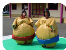
Combats de sumos