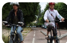
(Re)mise en selle