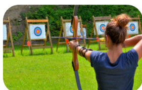
Initiation tir à l'arc

Nous nous déplaçons à votre domicile ou alentours pour vous initiez à différentes activités sportives. Initiations encadrées par des éducateurs diplômés. Jusqu'à deux personnes par cours.